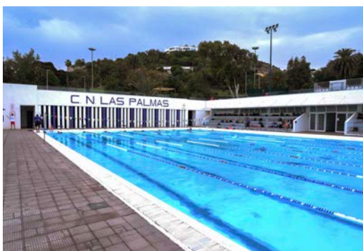
Club Natación Las Palmas

La natación es el deporte del verano por excelencia, además de ser ahora el mejor momento para que sus hijos aprendan o continúen aprendiendo este deporte. Es por ello que los alumnos acudirán dos veces por semana al Club Natación Las Palmas.